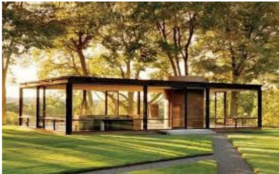
La maison de verre