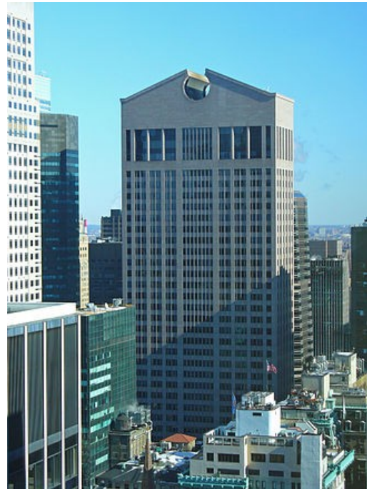
La Sony Tower