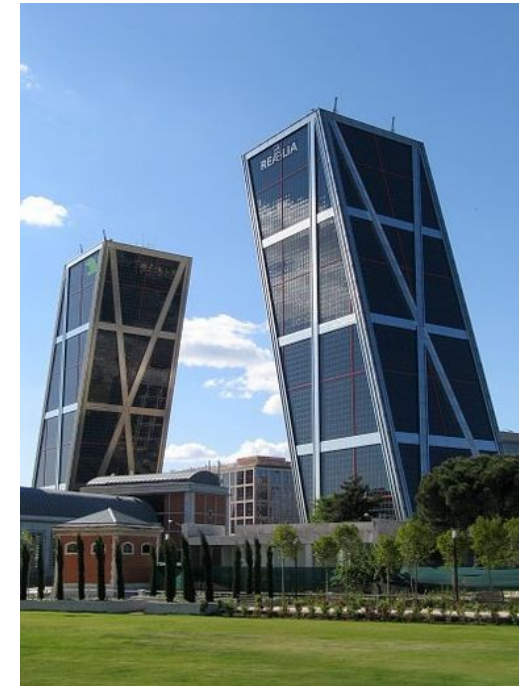
La porte de l'Europe