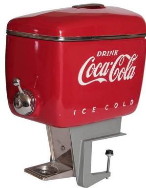
Coca cola, 1950'

Un des principaux qui a bercé le style « paquebot » C'est un designer industriel et graphiste