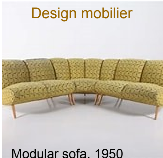
Modular sofa, 1950