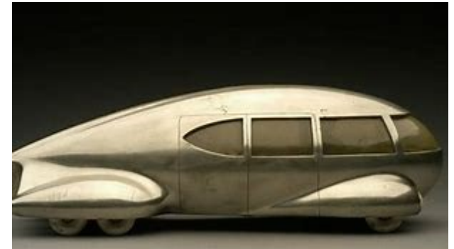
Motorcar No.9 rearview, 1932