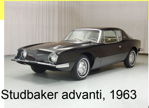
Studebaker advanti, 1963